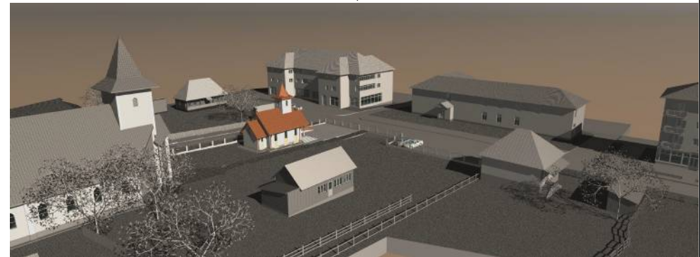
AMPLASAMENT STUDIAT - PROPUNERE AMPLASAMENT CAPELA MORTUARĂ

P.U.D. - PLAN URBANISTIC DE DETALIU CONSTRUIRE CAPELĂ MORTUARĂ, comuna BĂIUȚ, nr.420A, MM ZONA IS- din cadrul Zonei centrale Subzona C2 - subzona Centrului nou - comuna Băiuț (zonă cu iterdicție temporară de construire până la aprobare PUZ/PUD)