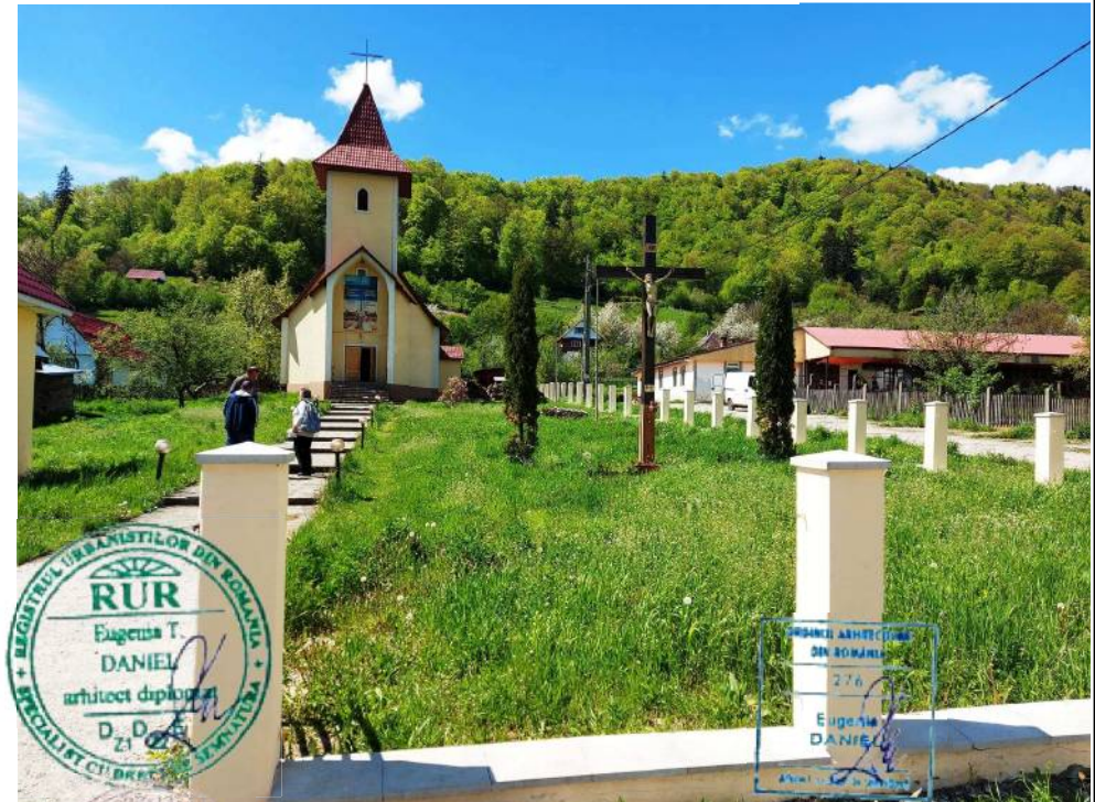
AMPLASAMENT STUDIAT - SITUATIA EXISTENTA